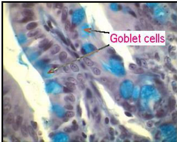
شکل ۱: (گروه کنترل) سلول‌های جامی شکل ناحیه پرزهای ایلئوم (محل فلش) دیده می‌شود. نظم سلولی و تراکم سلول‌های ناحیه لامیناپروپریا طبیعی است.

ایلئوم ریزش داشت و از نظر اندازه (ارتفاع و ضخامت) نامنظم بودند. عروق لنفاوی آنها متسع شده و فواصل این عروق از هم نامنظم بود. ناحیه زیر مخاط و کوریون تحت نفوذ سلول‌های آماسی قرار گرفته بود (شکل ۱).