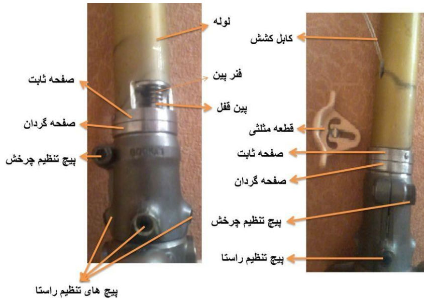
شکل-۲. جزئیات عملکرد قطعه چرخاننده مچ پای پروتزی