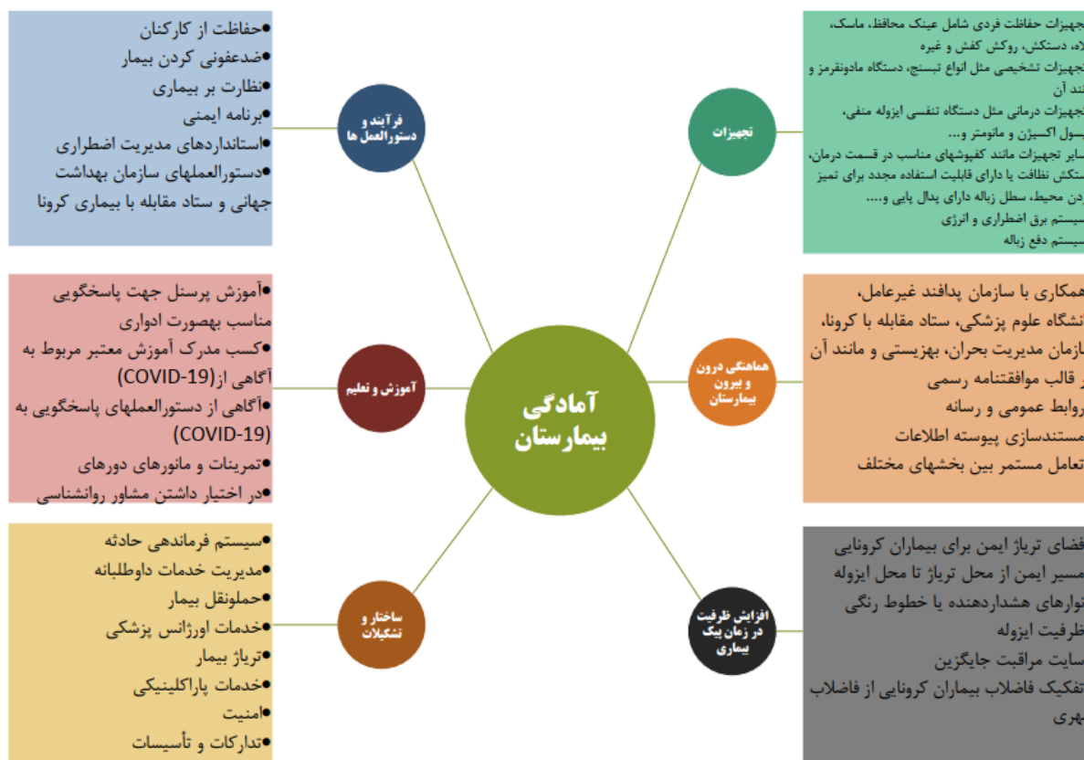
شکل-۱. الگوی آمادگی بیمارستان برای مقابله با بیماری کووید-۱۹ (۱۷)

که مدیران از طریق پرتال بیمارستان پرسشنامه‌ی طراحی شده را برای بخش‌های اورژانس، پرستاری، بخش مراقبت‌های ویژه ICU و پزشکان متخصص عفونت ارسال نمایند. بعد از ارسال پرسشنامه آنلاین به مدیران بیمارستان و تکمیل پرسشنامه از جانب آن‌ها اقدام به جمع‌آوری و تجزیه و تحلیل داده‌ها شد. شیوه امتیازبندی سؤالات به این صورت بود که سوالاتی که با (بله) پاسخ داده شده بود ۲ امتیاز منظور شد و برای سوالاتی که با (تا حدودی) پاسخ داده شده بود امتیاز ۱ و سوالاتی که با (خیر) پاسخ داده شده بود صفر امتیاز در نظر