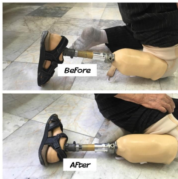
شکل-۳. عملکرد قطعه چرخاننده مچ پای پروتزی در وضعیت دو زانو در فرد قطع عضو