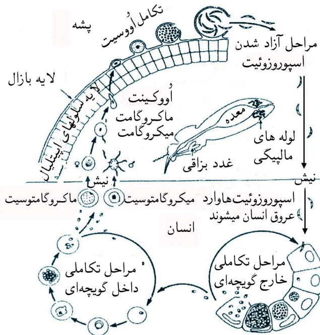
شکل ۲- چرخه انتقال و رشد انگل مالاریا را نشان می‌دهد.

مالاریا در طی جنگ جهانی دوم ۸۰٪ از پرسنل هند که در برمه مستقر بودند را آلوده نمود، به طوری که سیستم خدمات بهداشتی