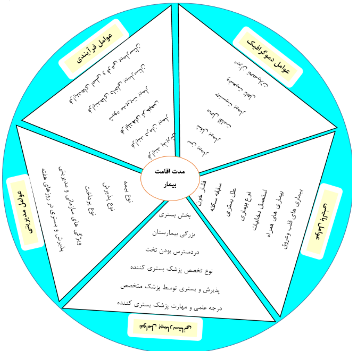
شکل-۲. عوامل موثر بر مدت اقامت بیمار در بیمارستان براساس مرور متون

با مرور دقیق جزئیات مقالات منتخب، در سه مقاله عوامل مربوط به نیروی انسانی (کیفیت خدمات ارائه شده توسط پزشک و پرستار، حضور پزشک و پرستار آموزش دیده)، در چهار مقاله عوامل