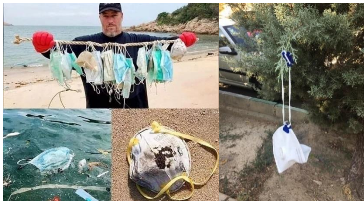
شکل-۲. رهاسازی ماسک‌های مصرف شده در محیط (https://i.redd.it/fmu6ap8jcs851.png)

سلامت در مبارزه با همه‌گیر شدن بیماری‌ها " معرفی نموده است. بنابراین شناسایی و معرفی به‌موقع چالش‌ها و مشکلات بهداشتی در دوره همه‌گیری کووید-۱۹ می‌تواند نقش مؤثری در برنامه‌ریزی دقیق‌تر برای پیشگیری از اقدامات موازی و به‌موقع داشته باشد و رهنمودی برای آینده باشد.