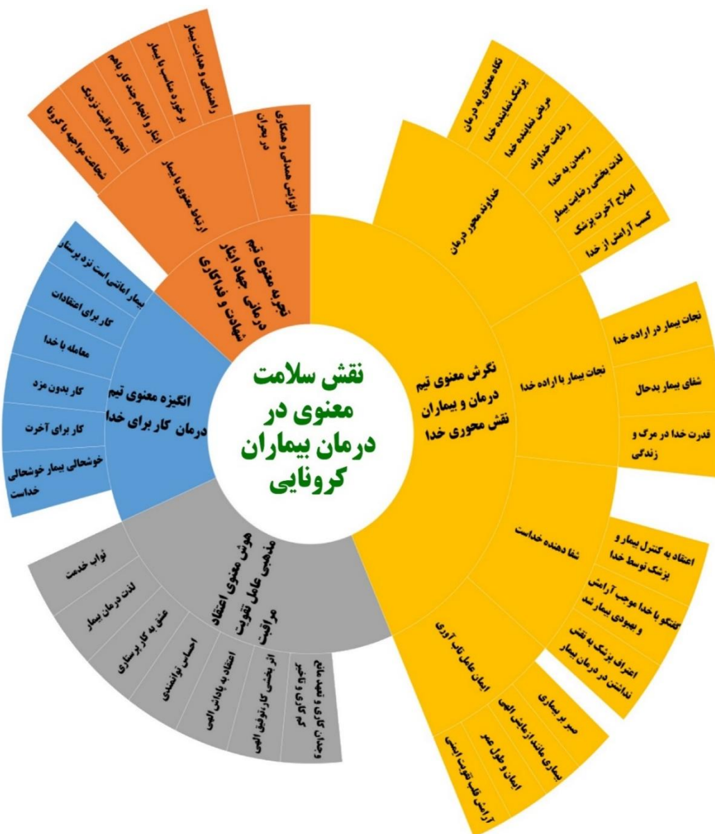
شکل-۲. چارت انفجار خورشیدی حاصل از کدگذاری محوری و انتخابی

یافته‌های مطالعه عبدالرحیمی و همکاران درباره تاثیر هوش معنوی بر عملکرد حرفه‌ای (۲۴) و یافته‌های شریف‌نیا و همکاران درباره تاثیر هوش معنوی و سلامت معنوی بر کاهش اضطراب مرگ و افزایش آرامش بیماران (۲۵) و یافته‌های Emmons مبنی بر اینکه هوش معنوی با افزایش قدرت خودآگاهی انسان، موجب می‌شود تا افراد در برابر مشکلات و سختی‌های زندگی، تاب‌آوری بیشتری از خود نشان دهند، هم‌خوانی دارد (۲۶). هوش معنوی به کارکنان درمانی، بیماران و خانواده آن‌ها توان‌سازگاری با مشکلات و احساس آرامش می‌داد و آن‌ها را در مقابل پیشامدها، خوش‌بین و امیدوار نگه می‌داشت. این یافته‌ها با نتایج تحقیق معاضدیان و باقری که نشانگر تاثیر مثبت آموزش مهارت‌های معنوی بر تقویت نگرش بیماران به معنویت، کاهش ضربه‌های روانی و سازگاری‌های خانوادگی، عاطفی، اجتماعی و جسمانی در بیماران است، هم